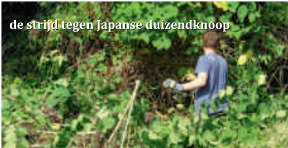
de strijd tegen Japanse duizendknoop