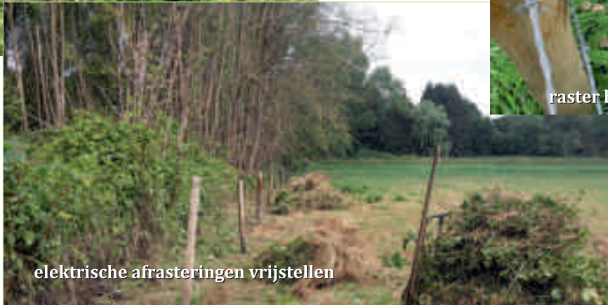
elektrische afrasteringen vrijstellen