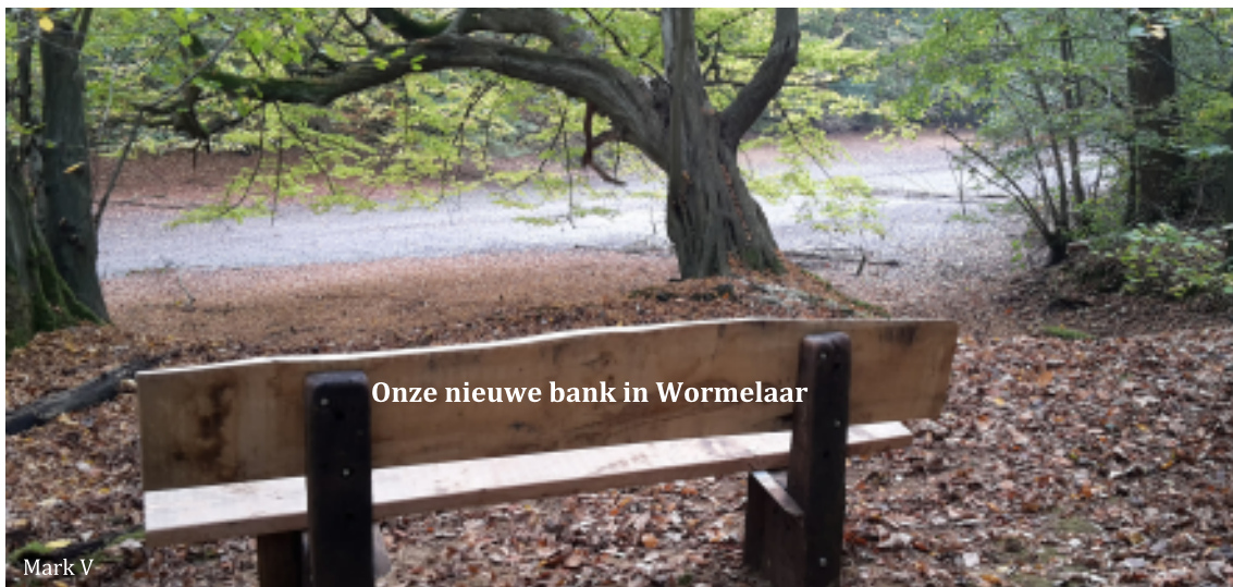
Onze nieuwe bank in Wormelaar

Woensdag 26 september, 3, 10 en 17 oktober PADDENSTOELEN IN DE PRAKTIJK Kerk Weerde 14 u - Deelname € 3 per excursie - Loepje meebrengen Een organisatie in samenwerking met Natuurpunt CVN.