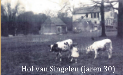
Hof van Singelen (jaren 30)